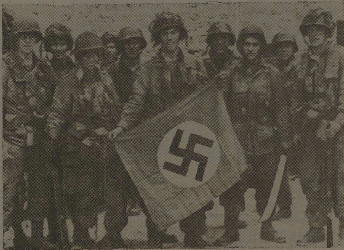
Paraquedistas do Exército dos Estados Unidos mostram numa aldeia da França uma bandeira nazista tomada em combate. O transporte de eletivos pelo ar permitiu a descida de milhares de soldados atrás das linhas alemãs, que foram apanhadas entre dois fogos.

Anúncios mediante contrato. Os originais, mesmo não publicados, não serão devolvidos. A direção não se responsabiliza pelos conceitos emitidos nos artigos assinados