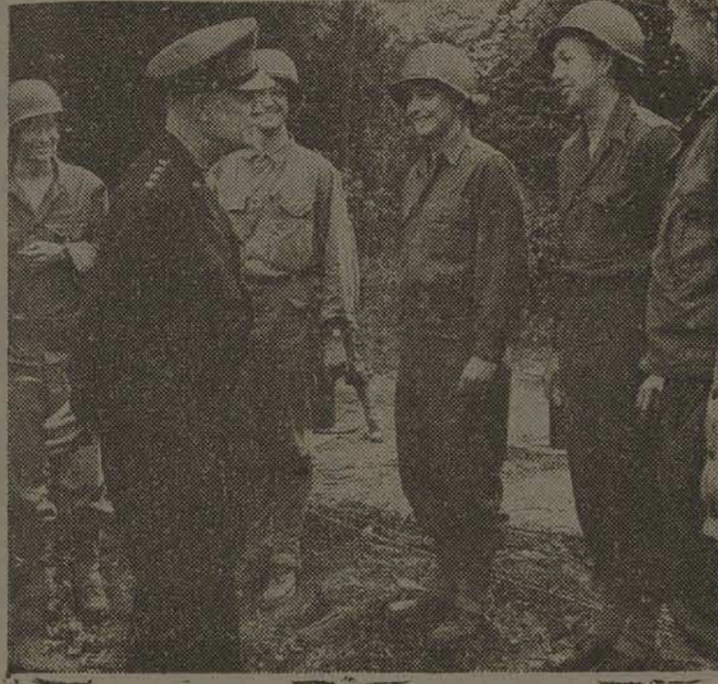
O general Dwight D. Eisenhower, comandante supremo das forças das Nações Unidas que atacam a Alemanha pelo oeste, aparece aqui conversando com soldados americanos na frente de luta. Como soldado de infantaria, o general deseja saber se os seus homens recebem os devidos cuidados e boa alimentação.