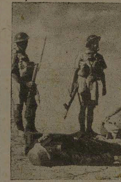
POSICÃO CAPTURADA. — A fotografia, feita numa das mais rijas ações do 8º Exército, mostra uma posição alemã caída em poder dos britânicos.

O PRECEITO DO DIA Além das "roséolas" (manchas róseas, amareladas ou escuras) podem ser observadas na pele outras manifestações da sífilis secundária, estas em forma de pequenos grãos que parecem lentilhas: são as "pápulas" que, às vezes, podem transformar-se em feridas cheias de pús ou em pequenas úlceras. SNES.