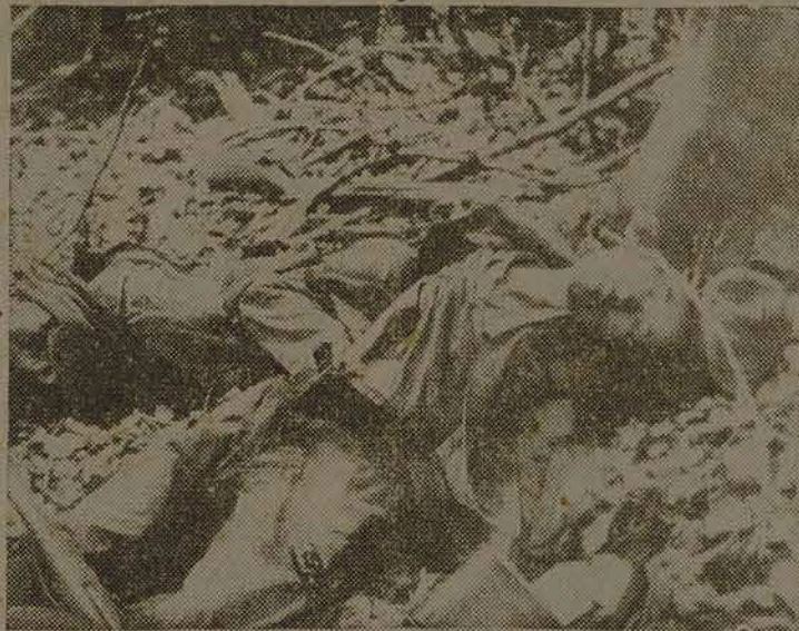
Este guerrilheiro japonês foi morto, quando, escondido entre as selvas espessas da Nova Guiné, procurava atirar sobre as tropas vitoriosas norte-americanas que avançavam vigorosamente naquela frente, sob o comando de Mac. Arthur.