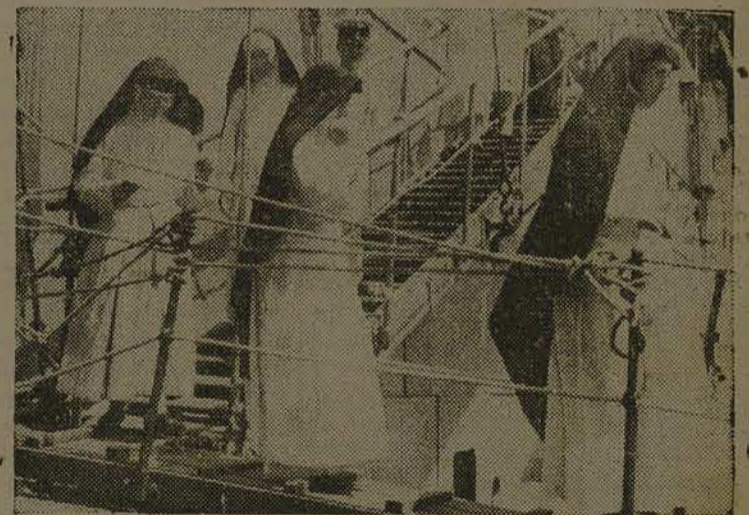
Missionárias norte-americanas internadas pelos japoneses depois de ocupação de diversas povoações chinesas, deixam o navio que as conduziu à Índia Portuguesa de acordo com um convenio de troca de prisioneiro.