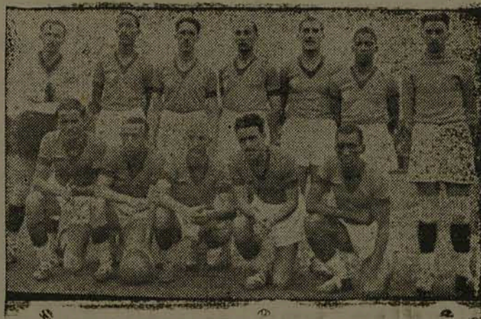
A seleção paranaense de 1938

Rio, 7 (E.) O Flamengo está interessado em contratar os jogadores argentinos Fidele e Boldonado.