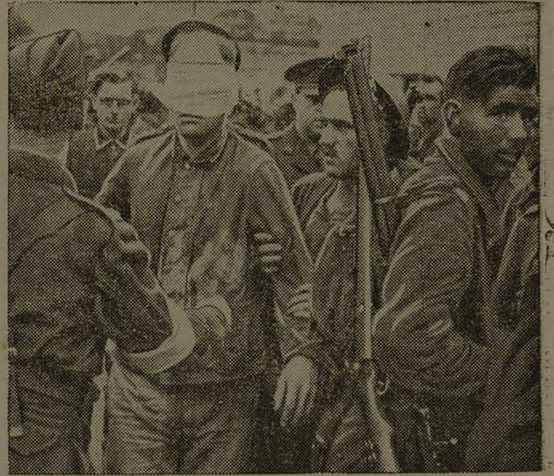
Vemos na fotografia um soldado germânico prisioneiro ao ser desembarcado num porto aliado.