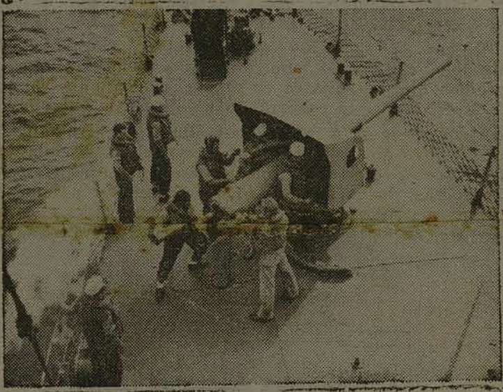
Estes artilheiros a bordo de um destróier norte-americano em serviço de patrulha, estão prontos para entrar em ação logo após o alarma. A ação destes destróieres tem permitido a chegada de comboios e mais comboios de suprimentos às Nações Unidas. (Cliché da Inter-Americana para O ESTADO).

Rio, 15 (E.) — Divulga um matutino desta capital: "O coronel Orozimbo Martins Pereira, diretor do serviço nacional de defesa passiva anti-aérea, viajará, hoje, para São Paulo, a fim de se inteirar do desenvolvimento dos serviços de defesa passiva, seguindo, depois de dois dias, para os Estados do Paraná, Santa Catarina e Rio Grande do Sul, com o mesmo objetivo".