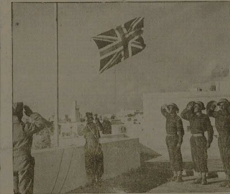
Num "ponto indeterminado" da Africa do Norte, conquistado pelos Dragões Reais Britânicos, vemos soldados das torças imperiais em continência, no momento em que a Union Jack era hasteada.