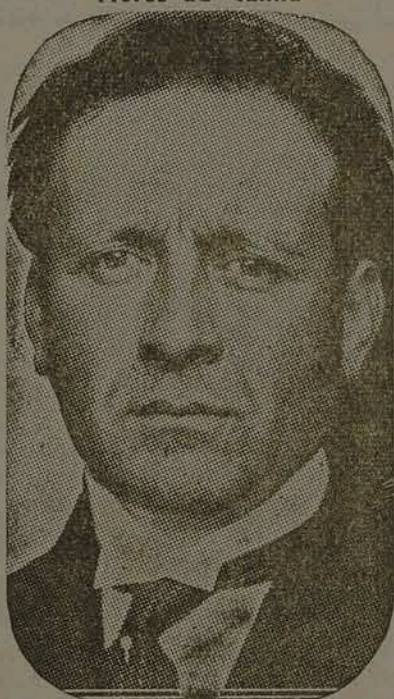
Montevideu, 6 (United Press)

— As primeiras horas da madrugada de sábado partiu o general Flores da Cunha, ex-governador do Estado do Rio Grande do Sul, o qual desde há 4 anos se encontrava exilado no Uruguai. Viajou ele para a cidade uruguaia de Rio Branco, de onde cruzará a ponte do rio Jaguarão, para tomar um avião militar que o levará ao Rio de Janeiro.