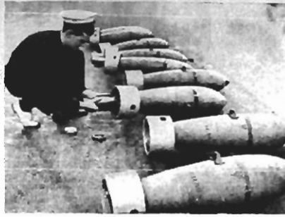
A Aviação Naval Britânica bateu a linha naval italiana. Nesta fotografia, tirada a bordo de um porta-aviões, um marinheiro é visto adaptando um dispositivo que segura as bombas impedindo que deflagrem antes de serem colocadas no avião.

R. Conselheiro Mafra 4 e 5 (edifício do Mercado, frente à Casa Hæpcke). FONE 1.542