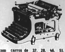
com teclado "universal" de 4 carreiras de teclas

Produtos da WANDERER WERKE SCHOENAU CHEMNITZ Alemanha