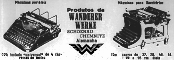
com teclado "universal" de 4 carreiras de teclas com curso de 27, 28, 40, 51, 65 e 95 cm diâmetro

NOVAMENTE À VENDA as afamadas MAQUINAS DE ESCREVER "CONTINENTAL"