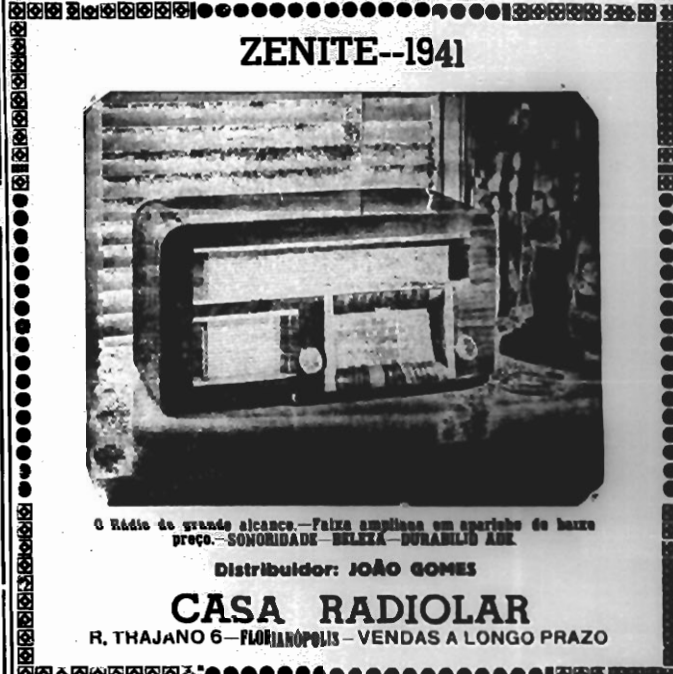
O Rádio de grande alcance — Faixa amplíssima em aparelho de baixo preço — SONORIDADE — BELEZA — DURABILIDADE