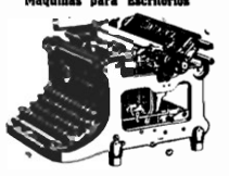
Máquinas para Escritórios

Produtos da WANDERER WERKE SCHOENAU CHEMNITZ Alemanha