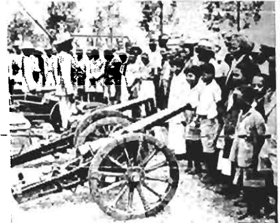
Algumas metralhadoras e canhões italianos capturados pelas forças britânicas, chegaram à Nairobi, Kenya, e foram colocadas de modo que o povo pudesse admirá-las. O clichê mostra o povo de Nairobi olhando com interesse as armas e munições italianas apreendidas.

Acácio Moreira ADVOGADO Consultas e pareceres Ações civis e comerciais VISCONDE DE OURO PRETO, 70 Fone 1.277