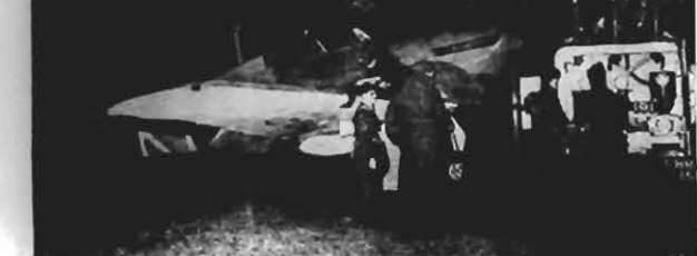
O "Hurricane" que se vê na fotografia voltou à sua base para buscar mais combustível. Logo estará voando novamente na constante caça dos bombardeiros alemães.