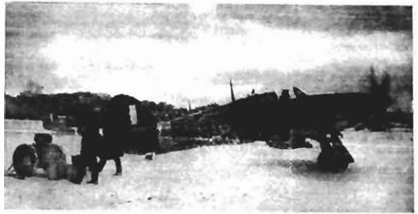
O esquadro de caça britânico "Hurricane", adotado por Burma, foi o primeiro esquadro nacional a entrar em ação contra a Força Aérea Italiana. O Esquadro Burma tomou parte na grande batalha aérea sobre Londres, em Setembro de 1940, quando 185 bombardeiros alemães foram derrotados. Na fotografia vemos pilotos dos caças Hurricane saltando no campo de aviação.

Se os russos puderem manter uma frente de combate em algum ponto, embora seja além de Moscou, a linha de equilíbrio corresponderá à Grã-Bretanha lançar a contra-offensiva decisiva.