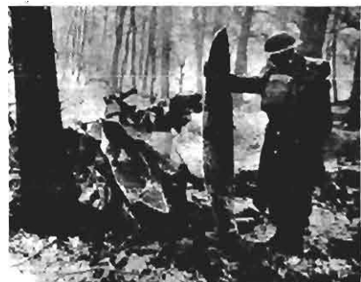
Os caças noturnos da RAF cada vez têm tido maiores vantagens sobre os atacantes inimigos. O clichê mostra um gigante "Dornier", um dos bombardeiros inimigos derribados nos arredores de Londres, por caças noturnos britânicos durante recente raid.