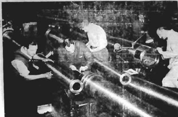
Numa fábrica britânica de armamentos, brilhantes canos de metralhadoras recebem os últimos retoques. Está situada «algures na Inglaterra», onde os trabalhadores lidam incessantemente na produção sempre crescente de armamentos

Na Vulcanizadora Leonetti, à rua Francisco Tolentino n.º 12-B, (junto à Fábrica Damiani) coloca-se sola nova, ou qualquer concerto em sapatos de borracha, galochas, cintos de senhoras, bolsas d'água, hicleletas e pinturas a Duro (à pistola) nas mesmas. Correias de lona e borracha para todos os fins. — Preços módicos.