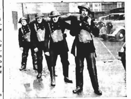
Membros do Serviço de Bombeiros Auxiliares, em Londres, não desanimam na sua sobre-humana luta contra os assaltos bárbaros das bombas nazistas.