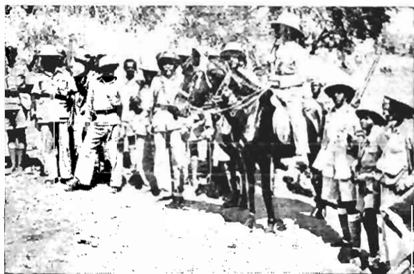
À frente das tropas patrióticas, Haile Selassie, fez a sua entrada triunfal em Addis Abeba, a capital do seu Império, que durante anos ficou sob o domínio italiano. Uma parte da marcha das forças patrióticas abissínicas sobre a capital foi realizada através de uma extensão de 200 milhas de montanhas áridas e da «jungle», durante a qual perderam 250 camelos que serviam para o transporte de material de guerra. Na gravura acima vemos Haile Selassie, a cavalo e cercado pelos homens da sua Guarda Pessoal, justamente pouco antes da entrada em Addis Abeba.

(Foto de British News Service para O ESTADO)