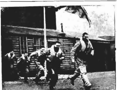
Servindo com a RAF está uma esquadrilha de caça composta de checos, que tem alcançado grandes vitórias sobre o inimigo desde o início da guerra. Aqui se vêem os pilotos dirigindo-se para os seus aviões, logo após ouvirem o sinal de alarme.

O segundo acontecimento foi a saudação do primeiro ministro britânico a propósito da mesma data. O sr. Churchill desconhece a animadversão do governo francês de emergência, ou, melhor, conhece os motivos que ditam essa animadversão. Por isto, não malina os que cumprem uma triste missão — e afinal alguém havia de cumprí-la — e saúda, no general De Gaulle, os que confiam na rendição da França pela vitória comum, para que, como a Síría e o Líbano, ora libertos do controle de Wiesbaden, a grande nação latina volte à sua posição predominante na Europa, esquecendo, para sempre, a desdita que a colheu.