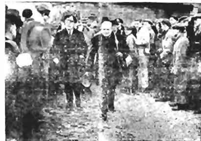
O Primeiro Ministro da Grã-Bretanha, Mr. Winston Churchill, recebe demonstrações de agrado por parte dos operários do Arsenal de Marinha, na sua recente visita a Southampton e Portsmouth. Observe-se que Mr. Churchill leva a sua máscara contra gases e seu capacete de aço.

Colocar-se-ia assim em posição propícia para poder negociar tratados de comércio vantajosos com todos os países. Esses materiais, que são os da guerra, ele precisava vitalmente. Mandaria para as bandas de cá, à América, missões comerciais e financeiras e, depois, também missões militares. E, assim, depois de ter sob seu controle a Europa, ele procuraria fazer o mesmo com o resto do mundo. Esse o plano «de paz» que o Fuehrer pensaria adotar e apresentar e para o qual vem procurando adeptos.