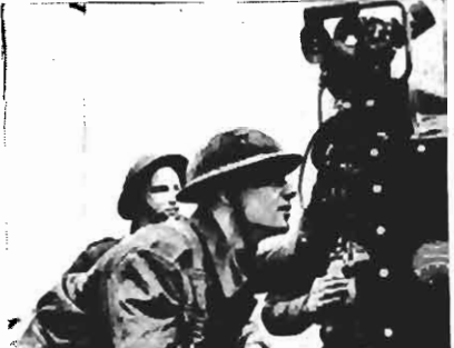
Um observador britânico com o maravilhoso instrumento que permite informar aos artilheiros anti-aéreos a posição do inimigo no céu.

Mas, o povo holandês recusou-se firmemente a trabalhar em qualquer cooperação com o Reich.