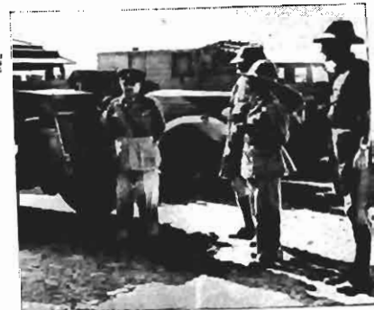
O cliché mostra o Imperador Selassie inspecionando o equipamento de um batalhão abissínio antes de partir para uma posição avançada. (Foto de «British News Service» para O ESTADO).

Mas todos as forças encarecidas da nossa defesa civil,