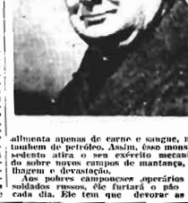
Alimenta apenas de carne e sangue, mas também de petróleo. Assim, esse monstro sedento atira o seu exército mecanizado sobre novos campos de mananha, plântagens e devastações.

Os pobres camponeses operários e soldados russos, que farão o plano de cada dia. Ele tem que devorar as co-