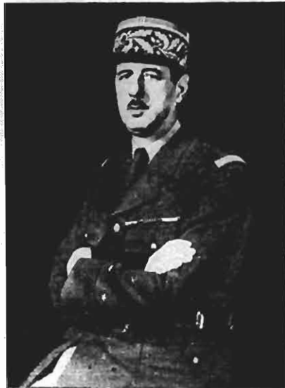
General Charles De Gaulle, inclito chefe dos Franceses Livres, que, ao determinar a invasão da Síria, apoiada pelas forças britânicas, lançou a seguinte proclamação: — «Oficiais, soldados, marinheiros e aviadores do Levante! Chegou finalmente a hora de recomeçar a luta pela libertação da França. Acaba de nomear o general Catroux como meu representante e comandante em chefe das forças francesas no Levante. Tendes de obedecer às suas ordens. Desta vez «venceremos» e a França ganhará a guerra. Até breve».

«Precisamos golpear o inimigo na Síria e na Líbia. Ninguém na Anatólia hesita, um segundo sequer, em declarar que os invasores germânicos não podem acobertar-se impunemente sob o manto da neutralidade do governo francês».