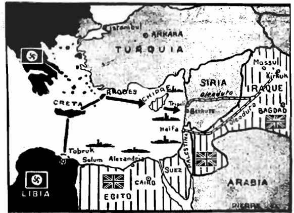
Por este pequeno mapa, que fizemos reproduzir para os leitores do ESTADO, pôde-se bem ver a posição da Síria e as suas condições estratégicas.

Cairo, 10 (Reuters) — A entrada das tropas aliadas na Síria e no Líbano é unanimemente aplaudida pela imprensa egípcia. O