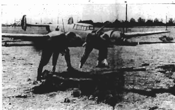
Um soldado e um polícia examinam a cratera de uma bomba na costa sul-oriental da Inglaterra. A bomba destinava-se ao avião que se vê mais para trás, mas os alemães erraram tanto na pontaria quanto no objetivo, pois o avião era um bombardeiro alemão derubado pelos britânicos.

ANO XXVII Florianópolis - Sábado, 7 de Junho de 1941 N. 8264