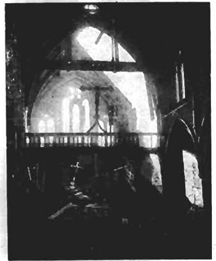
Em uma igreja onde estourou uma bomba alemã, ainda fica de pé o cruzifixo. Para estas coisas — para o direito de todo homem toda a mulher tem a crença e a vida que quiserem — é que a Grã-Bretanha está lutando.

Esse primeiro episódio da batalha do Atlântico foi conclusivo. O "Bismarck" foi sumária e limpa-mente executado, sem a mínima esperança de escapar à sentença. O episódio pôde ser decisivo para o curso da guerra, porque, conseqüentemente não divulgada a missão concreta que o "Bismarck" ia desempenhar, é indubitável que se tratava de ação importante no Atlântico. Se não fosse assim, os nazistas não teriam arriscado sua melhor unidade de combate.