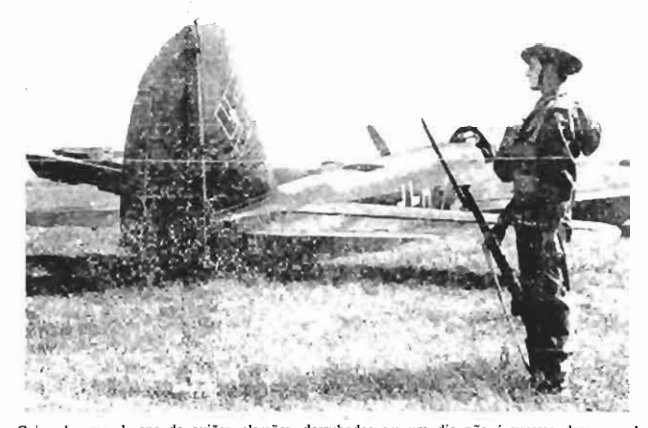
Coisa de uma dezena de aviões alemães derrubados em um dia não é sucesso descomunal para os pilotos das caças britânicas. Aqui está meramente um deles — cena banal — presentemente por entre as defesas costeiras da Grã-Bretanha.