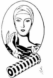
Elizabeth Arden apresenta CANDY CANE

CANDY CANE, a mais recente maquiagem de Elizabeth Arden, é uma tonalidade viva e alegre — um verniz claro e vibrante.