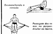
Desmanchando a remada