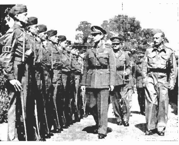
Contando agora mais de 1.700.000 homens e composta inteiramente de voluntários, a Guarda Interna (Home Guard) da Grã-Bretanha cresce constantemente em força. O Rei Jorge recentemente inspecionou um destacamento da zona de Londres, e ali encontrou os veteranos da guerra pasmada, e os jovens — (moços demais para serviço no estrangeiro) — de que se compõe a Guarda.