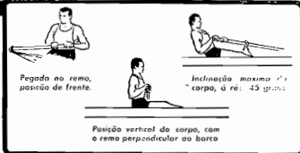
Inclinação maxima do corpo, á re: 45 graus.