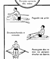
Pegada na pua