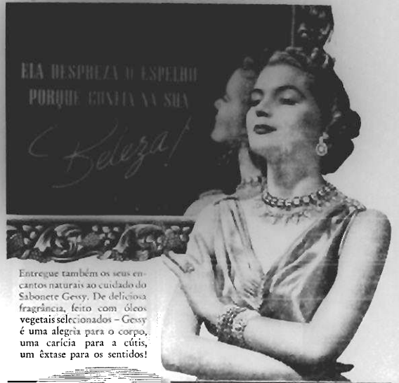
Entregue também os seus encantos naturais ao cuidado do Sabonete Gessy. De deliciosa fragrância, feito com óleos vegetais selecionados — Gessy é uma alegria para o corpo, uma carícia para a cutis, um êxtase para os sentidos!

O novo diretor técnico da Liga carioca, no seu projeto sobre a questão dos juizes, incluiu numa das clausulas, para os árbitros, que fossem contratados, a seguinte condição: treinar semanalmente, apitando treinos dos clubes filiados, afim de conservar a forma tanto fisicamente como espiritualmente, isto é, praticar a regra. A ser adotada essa medida, todos lucrariam, por que o juiz ensaia apitando e o jogador treina a obedecer as regras, acatando as decisões da maior autoridade em campo.