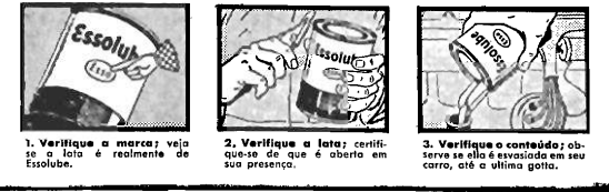
1. Verifique a marca; veja se o logo é realmente do Essolube. 2. Verifique a lata; certifique-se de que é aberta em sua presença. 3. Verifique o conteúdo; observe se éle é esvaziado em seu carro, até a última gota.