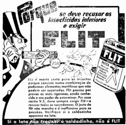
FLIT é morte certa para os insectos porque consiste numa combinação de poderosos elementos mortíferos que não podem ser superados. FLIT passou por provas as mais rigorosas, sendo conhecido o seu poder de exterminar. Por essa razão V.S. deve sempre exigir FLIT e recorrer apenas a esse produto. O facto de FLIT não manchar e ser inoffensivo para as pessoas. Verifique se o soldadinho aparece no lato. Si a lata não trouxer o soldadinho, não é FLIT

ANO NOVO - NOVA SORTE REALIZA-SE mais um sorteio no Crédito Mutuo Preadial, com um prêmio em mercadorias no valor de rs. 6.000$000 e muitos outros menores.