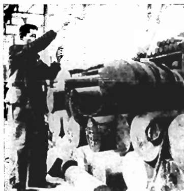
Empilhando munições para canhões da Marinha francesa.