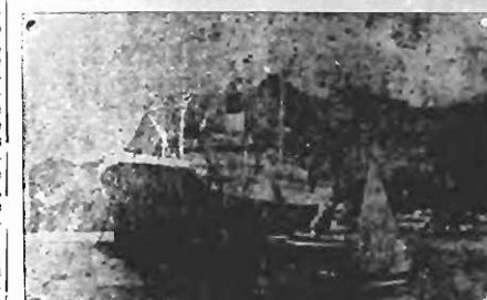
RIO, 25. — A phase da reforma no Lloyd Brasileiro foi iniciada.

Com a gestão de seu actual director, Almirante Graça Aranha, tem suscitado como era natural, opiniões as mais diversas. E' por tanto o caso de indagar até que ponto tem sido uteis á velha empresa de navegação — tão sacrificada no passado pelas intronmissões funestas de que não se livraram os mais importantes departamentos da administração pública, a administração do almirante Graça Aranha? Não é facil falar como o director do Lloyd, empolgado por uma actividade que interessa a todos os sectores da empresa, e que se traduz por um contacto directo com os chefes do serviço. Não foi porém impossivel forçar-lhe a discreção, para prestar ao jornalista algu-