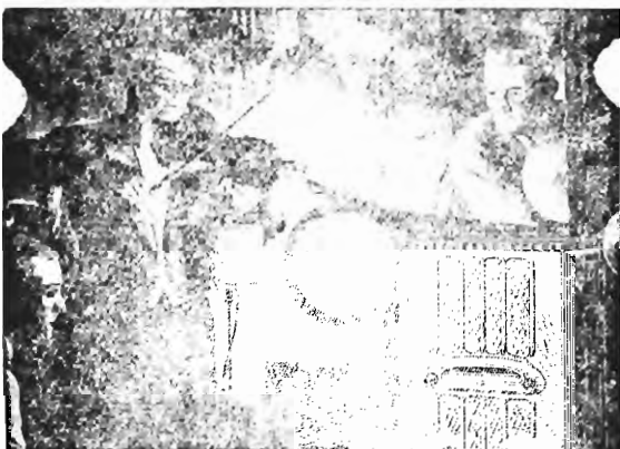
● SOM VISTO... E OUVIDO... NA "CASA DOS MAGICOS"

S. Paulo, — (Pelo correio) — Comunicam de Chaves: «Ha dias, na povoação de P.º, alguns boieiros encontraram uma vacca brava que, sendo solta á entrada da povoação arrombou uma cerca, investindo contra uma criança. A mãe da criança, e a criança, foram feridos. A criança morreu, morrendo a poucos momentos. A criança também ficou ferida».