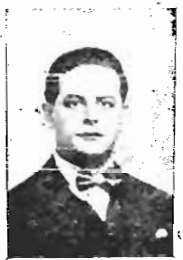
Figura politica das mais expressivas, que tem dado a Santa Catharina o melhor dos seus esforcos e da sua intelligencia...