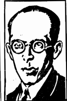
Sr. Gustavo Capanema Ministro da Educação

Rio, 14 — O esboço do orçamento, publicado pelo «Diario Official», menciona, entre as fontes de receita, o ensino secundario, cujo contributo attinge 15 mil contos annuaes. Vivemos a claimar que o Brasil é analfabeto, e que essa mícula precisa desaparecer dos nossos braços de pais civilizado.