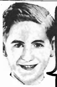
A FIGURA DO QUAKER SÓ NO LEGITIMO