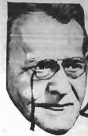
A FIGURA DO QUAKER SÓ NO LEGÍTIMO

PODEROSO ANTI-SYPHILITICO ANTI-RHEUMATICO ANTI-ESCROFULOSO —GRANDE— Depurativo do Sangue