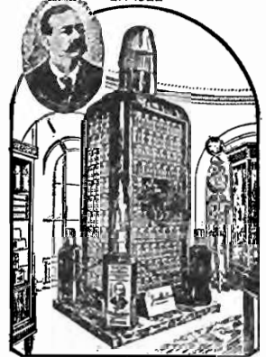
ELIXIR DE NOGUEIRA GRANDE DEPOSITARIO DO SANGUE Único que trata o consumo. Único que tem o seu preparado na Voz do Povo VENDE-SE EM TODO O BRAZIL E REPUBLICAS SUL AMERICANAS