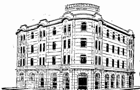
AL ECONOMIZADORA DO LAR