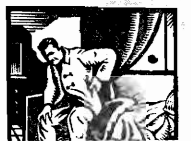
Remetta HOJE e pela volta da correia receberá um fornecimento para experiencia. Depois da primeira dose V. S. se felicitará por tel-o feito.