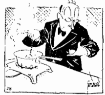
Caramba! Como este ovo está denotando a cozinha!