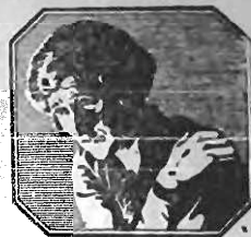
V. S. nada perderá e se beneficiará tomando uso de nossa offerta gratis. Envie o coupon HOJE MESMO.

Nós SABEMOS que as Pilulas De Witt são boas, e desejamos que V. S. o comprove, livre de qualquer despesa. Prevenha e evite-nos os casos de Rheumatismo, Sciatica, Lumbago, Molestias de Acido Urico, Doençadas dos Rins e da Bexiga. Se o seu caso é susceptivel de tratamento, as Pilulas De Witt lhe farão bem. Portanto,