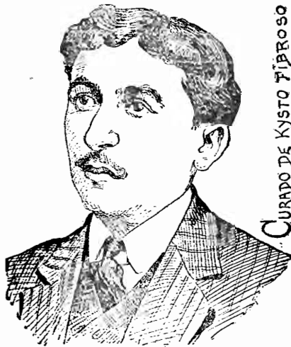
CURADO DE KYSTO FIBROSO