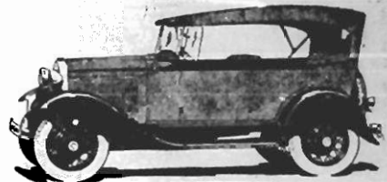
TURISMO - Tem os assentos bem baixos, de modo que oferecem o maximo conforto. Os parabrises, deslizo e laterais, do vidro Triplex que não estilhaça, podem ser doilados sobre o painel. Uma só pessoa basta para manear a capota.