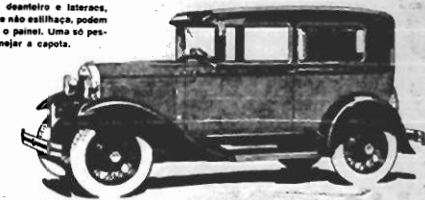
SEDAN 2 PORTAS - Accommoda, confortavelmente, cinco passageiros. Os quatro amortecedores de choque, hidráulicos, Moullat, de dupla acção, combinados com o balço centro de gravidade e moles transversaes, tornam a marcha deste carro extremamente suave.