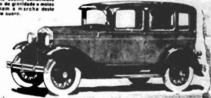
SEDAN 4 PORTAS - Amplo interior guardado e estuado com excellent bom gosto. O assento deslizo e ajustavel. A alimofada trasversal accommoda bem tres pessoas. Portas largas que tornam facil o accesso ao interior. Agradavel e bem disposto luz interior.