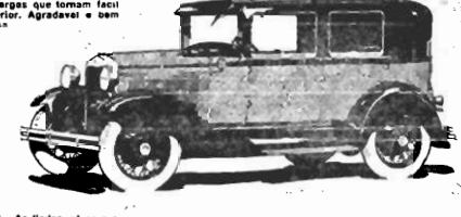
SEDAN DE LUXO - As lindas cores e o rico acabamento dão a este Sedan uma atmosphera de luxo raramente notada em carros de preço baixo. O estofamento pode ser de cordão de lá (Blenford cord) bello escuro ou do chamelo perdo (Mohair).