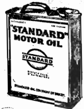
«Digno da responsabilidade»