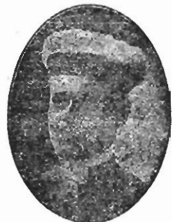
Dr. Dionysio de Magalhães Ilustração medico e clinico

Escrevi e assigno. Elpidio Hyppolito da Silva Estado do Rio Grande do Sul - Arroio Grande, 22 de Agosto de 1928.