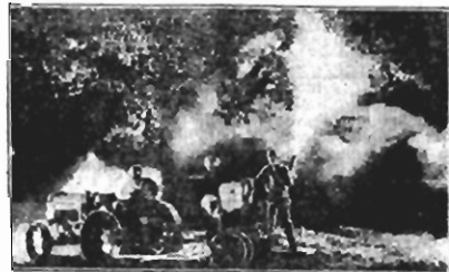
Applicação de Insecticida Agricola de noite com o auxilio d'um Tractor

Nova York (SIPA).— Os tractores McCormick-Deering têm sido chamados motores triplos porque permitem utilizar a sua força para tracção, com correa sem fim e directamente do veio do motor para accionar uma grande variedade de machinas auxiliares como engavelladores mecanicos, colhedores de milho, ceifeiras de ensilagem, machinas de segar especies, aparelhos para pulverizar, etc.