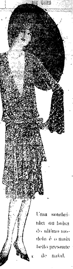
Uma sômbria ou bolsa do ultimo modelo é o mais bello presente de natal.