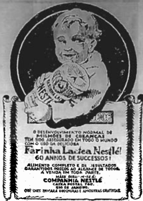
Alimento ideal para crianças