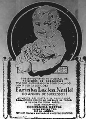
Alimento Ideal para crianças