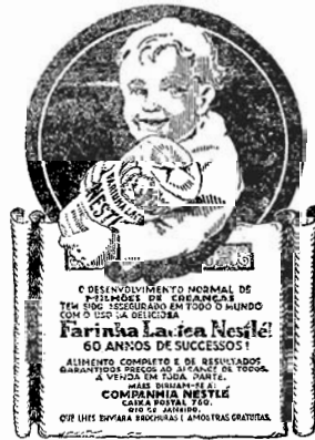
Alimento ideal para crianças

Os concessionarios: Angelo La Porta & Cia. FLORIANOPOLIS