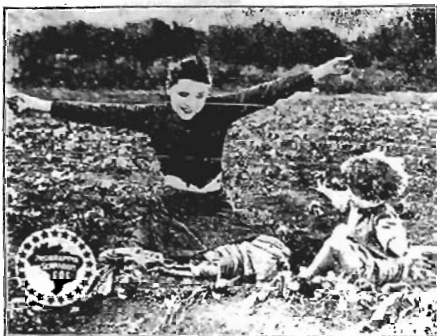
9 sensacionais partes

Hoje, Sabbado, ás 7 3/4 horas Empresa Cinematographica Victor Busch AMOR, HONRA e DESTINO