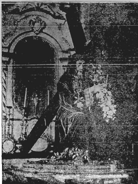
A Imagem do Senhor Jesus dos Passos

Hoje e amanhã, a população de Florianópolis, acrecida de elevado numero de romieiros procedentes das varias pontas da ilha e do continente fronteirico, prolongando uma tradiçao secular, val, de novo, demonstrar a piedade dos seus sentimentos catholicos.