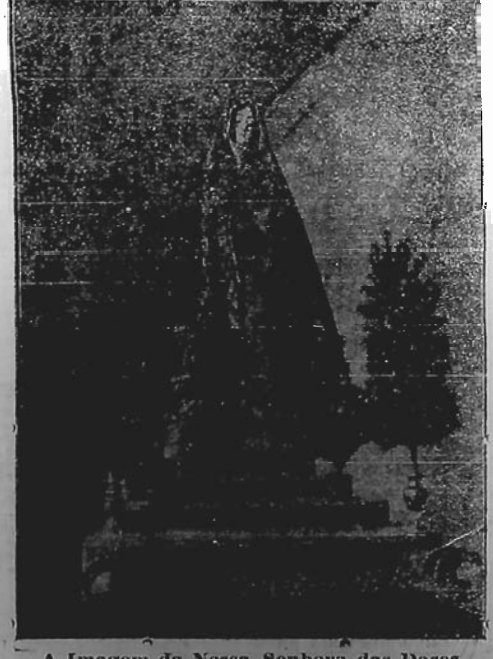
A Imagem da Nossa Senhora das Dores

Pharmacia de Plantão Estará de plantão amanhã a pharmacia Rauliveira, á rua Conselheiro Mafra.