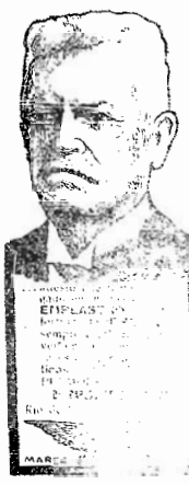
Non houve sessão da Camara...

O calculo será grande, mas, segundo affirmam, não haverá necessidade de abertura de novo credito.