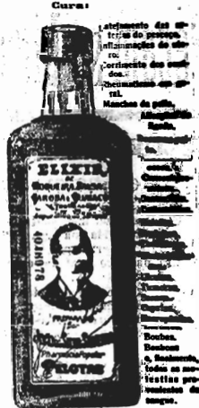
GRANDE REPERTÓRIO DO FARMACIA