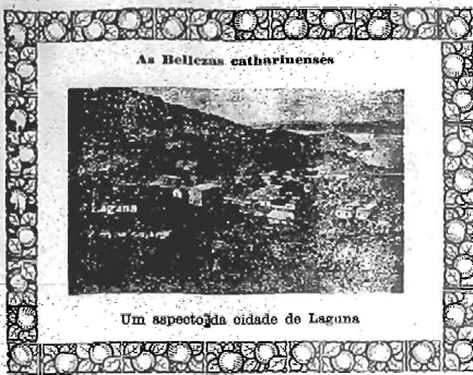
Um aspecto da cidade de Laguna