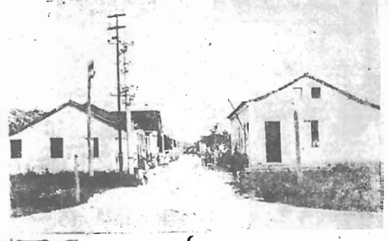
A rua Coronel Teixeira

O município de Biguassu, situado a duas leguas da capital do Estado, surgiu da antiga povoação de S. Miguel no ano de 1833.