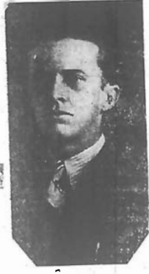
O SR. ALFREDO SILVA, Prefeito de Biguassu.