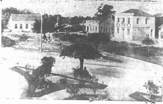
Um aspecto da praça dr. Neréu Ramos